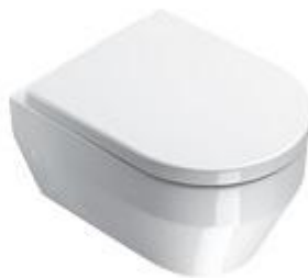
Serie Zero light